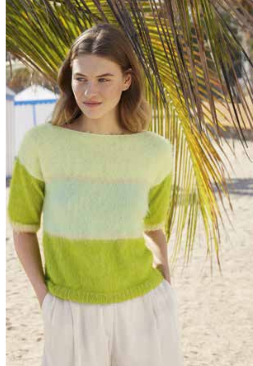
14 _ PULLOVER Das Anfängermodell von Seite 14, hier mit schlankerer Passform und verkürzten Ärmeln. Dazu gesellen sich kühle Pastelltöne – sinnlich inszeniert, dank Flauschgarn Finito (neu). FINITO