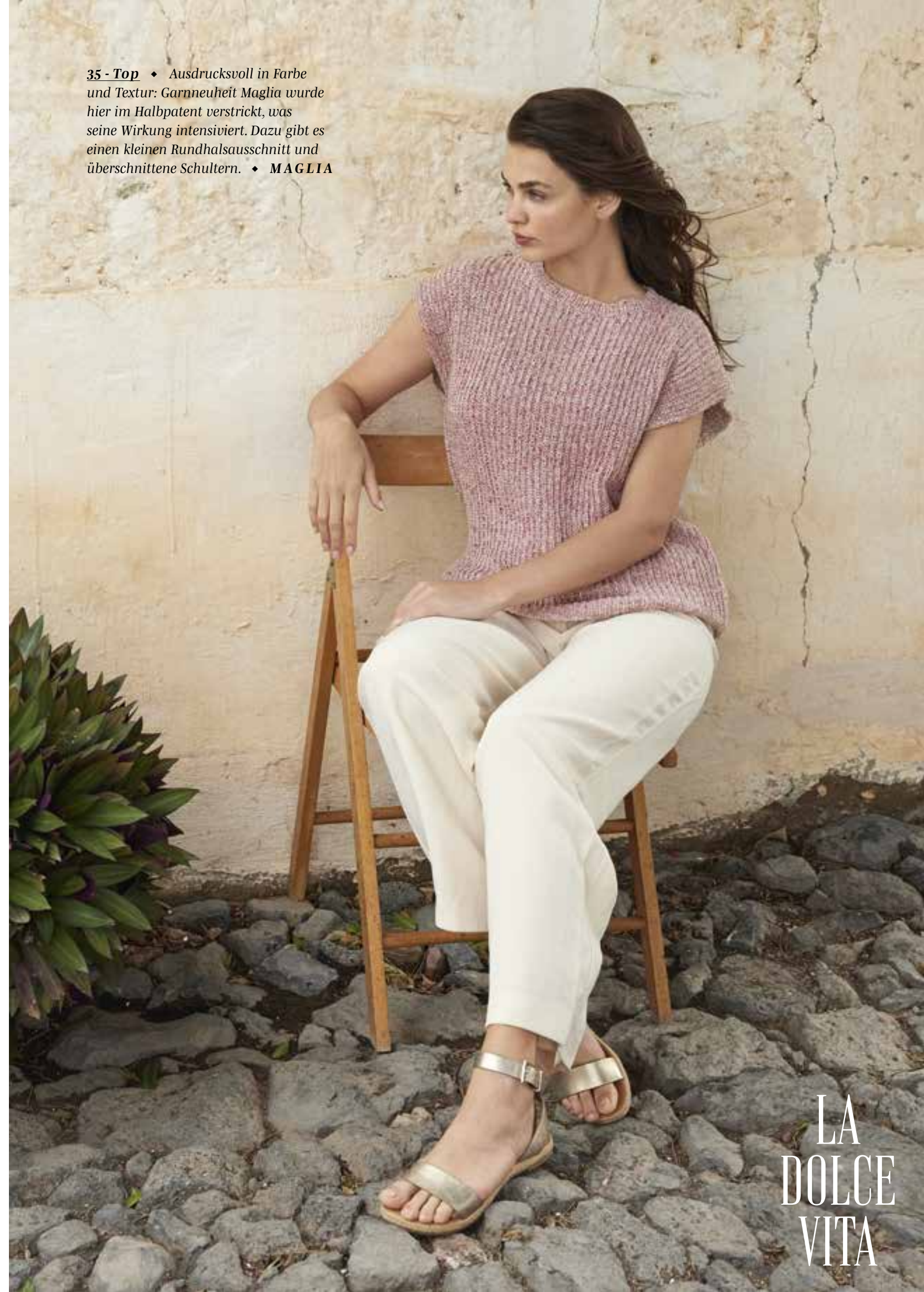
35 - Top ♦ Ausdrucksvoll in Farbe und Textur: Garnneuheit Maglia wurde hier im Halbpate verstrickt, was seine Wirkung intensiviert. Dazu gibt es einen kleinen Rundhalsausschnitt und überschnittene Schultern. ♦ MAGLIA