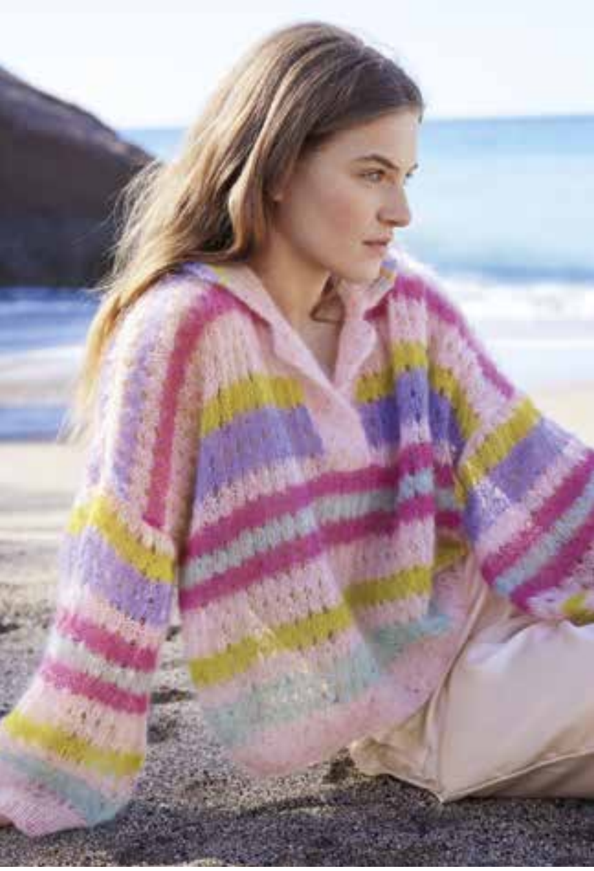
2 _ PULLOVER Pudertöne, Lochmuster und ein zartes Mohair-Gemisch machen den Oversized-Pullover leicht wie Luft. Abgerundet wird das Fashion-Piece von einem verschlusslosen Polokragen. NATURAL SUPERKID TWEED