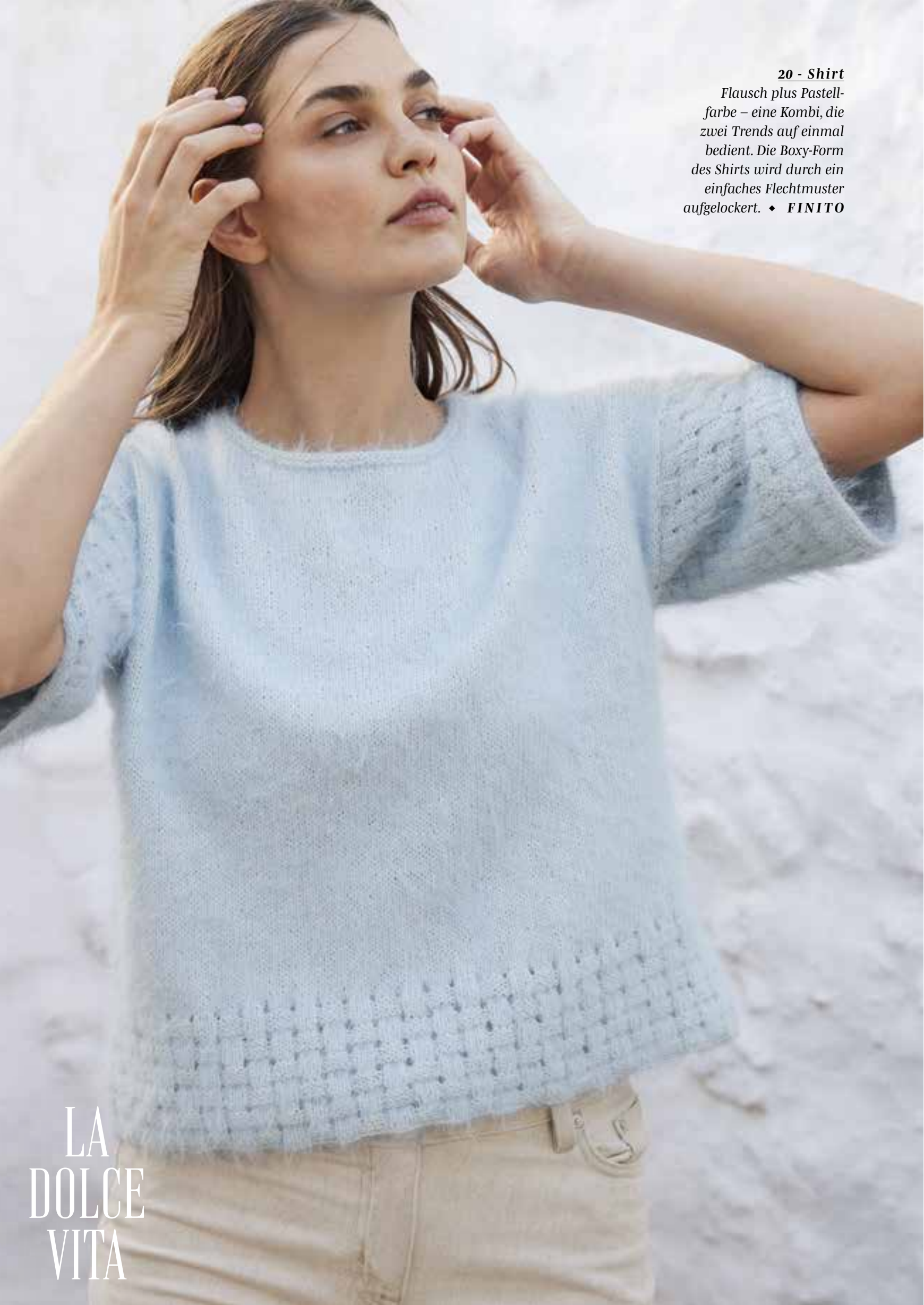
20 - Shirt Flusch plus Pastell- farbe – eine Kombi, die zwei Trends auf einmal bedient. Die Boxy-Form des Shirts wird durch ein einfaches Flechtmuster aufgelockert. ♦ FINITO