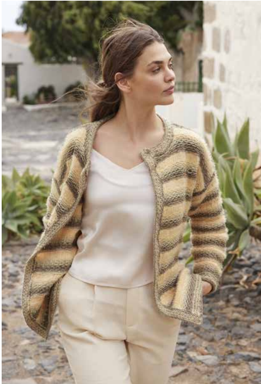
22 - Cardigan ♦ Couture-Allure liefert unser klassischer Cardigan mit Rundhalsausschnitt und markanten Blenden. Dazu gesellt sich ein interessanter Garn- und Mustermix. ♦ PROMESSA, RICCIO & PER FORTUNA