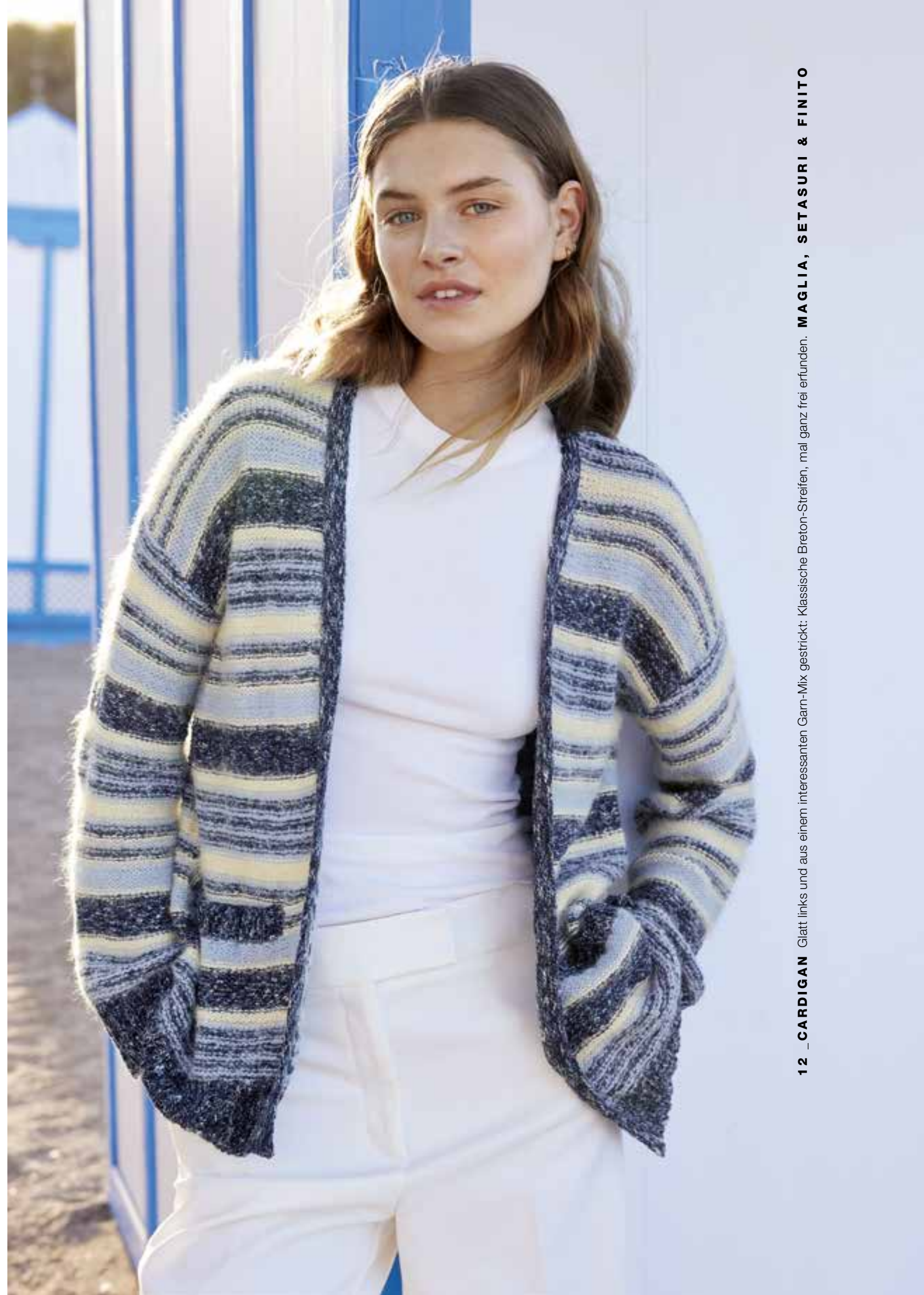
12 _ CARDIGAN Glatt links und aus einem interessanten Garn-Mix gestrickt: Klassische Breton-Streifen, mal ganz frei erfunden. MAGLIA, SETASURI & FINITO