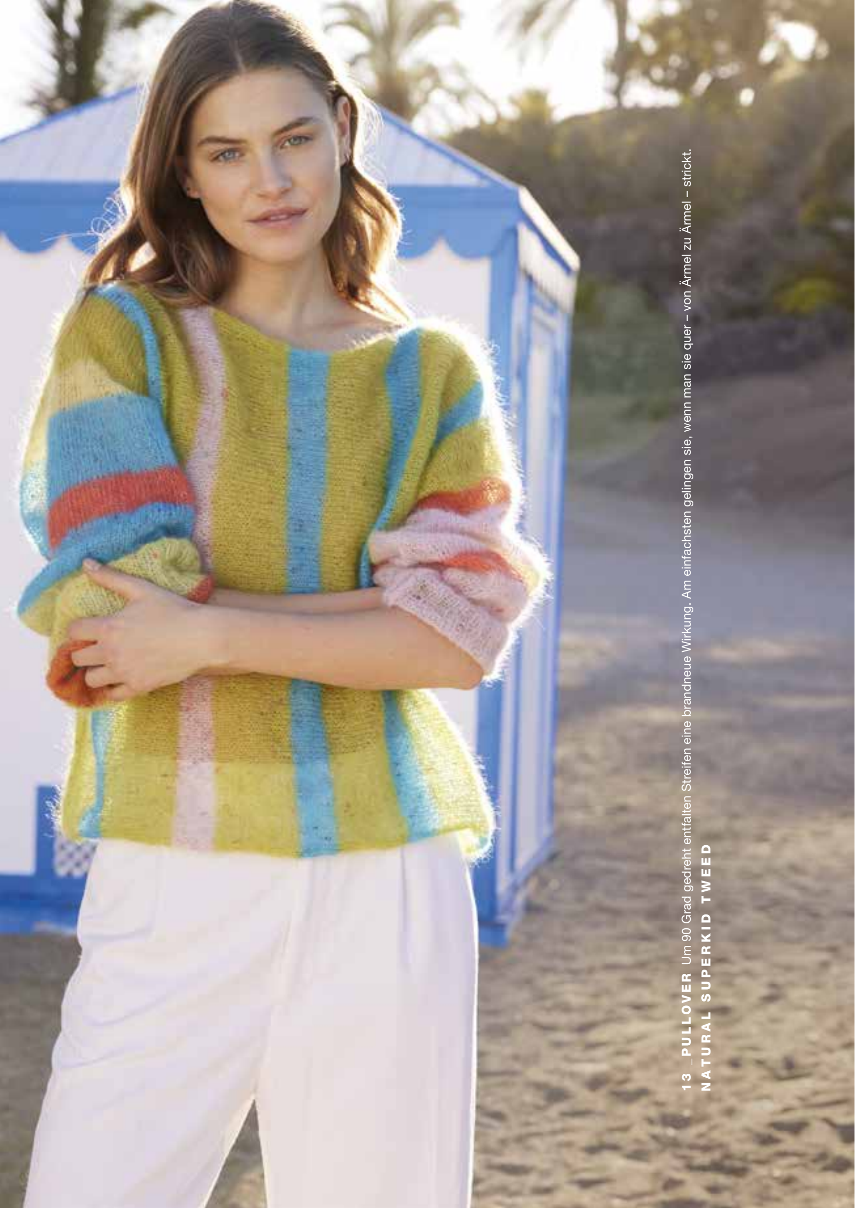
13 _ PULLOVER Um 90 Grad gedreht entfalten Streifen eine brandneue Wirkung. Am einfachsten gelangen sie, wenn man sie quer – von Ärmel zu Ärmel – strickt. NATURAL SUPERKID TWEED