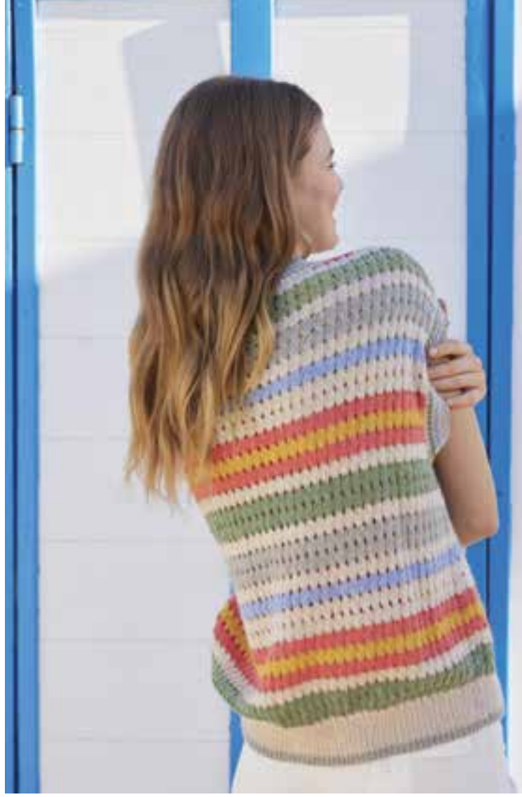
11 _ PULLUNDER Lochmuster, College-Streifen, dazu Retro-Töne und eine lockere Passform: Ein Pullunder, der Köpfe verdreht. ECO PUNO