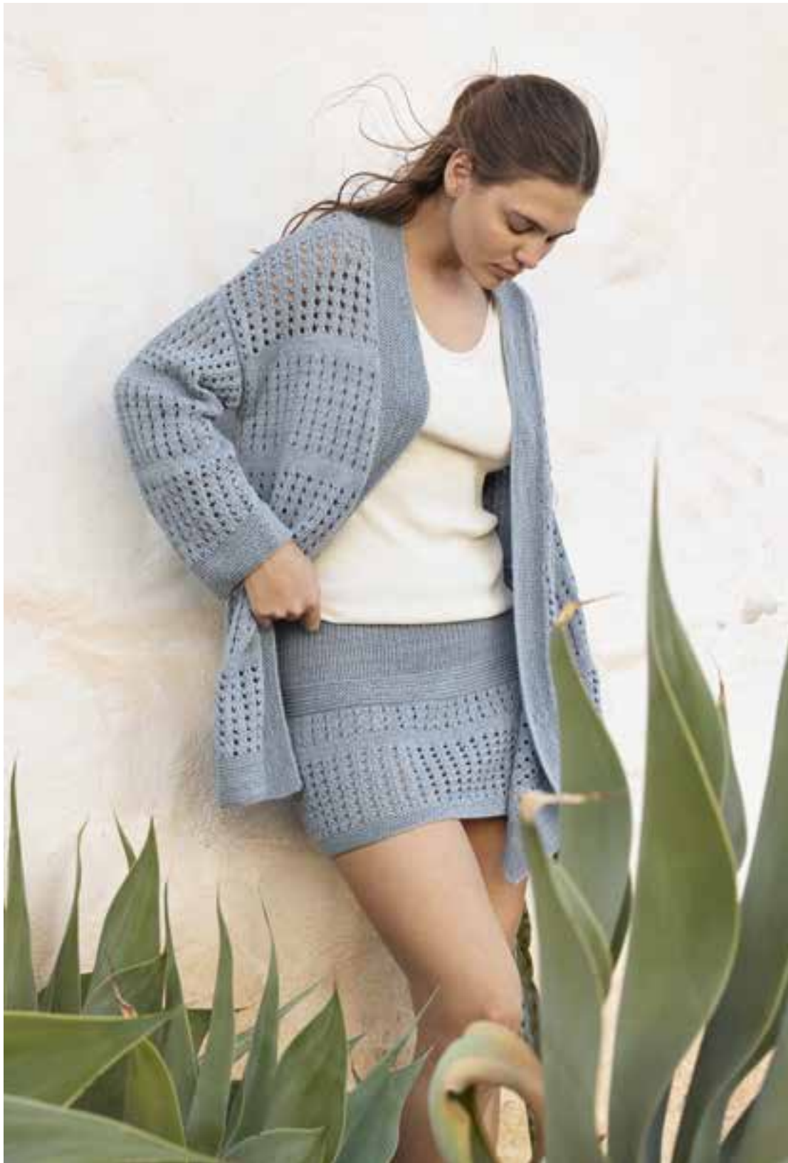
28/29 - Cardigan und Rock ♦ Ruhiges Graublau, klare Linien und ein grafischer Lochmustermix setzen bei diesem Set coole Akzente. Die kraus gestrickten Blenden verleihen dem Cardigan einen kompakten, sauberen Rahmen. ♦ CAMPO