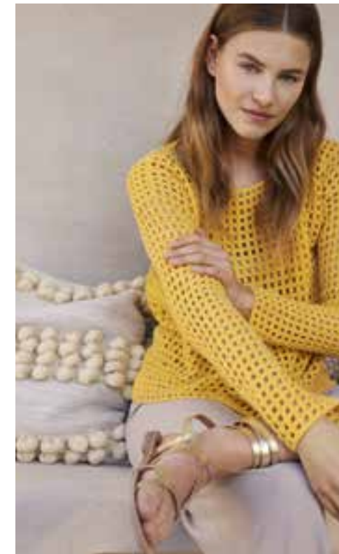
Seite 67 Modell 53

Mag die Welt auch verrückt spielen, wir stricken uns glücklich. Denn Stricken beruhigt und gibt Halt, wie ein Anker auf offener See. Schön dazu: Dieses Heft, mit 61 Modellen, die Ihre Vorfreude auf warme Tage wecken sollen – zum Beispiel mit angesagten Sorbet- und Grüntönen, opulenten Beerenfarben oder sanften Neutrals. Dazu gesellen sich ausdrucksvolle Muster, wie luftige Netzvarianten oder sportliche Rippen. Und natürlich Streifen, das Trend-Thema der Stunde. Tauchen Sie also ab in unseren Mikrokosmos der guten Aussichten. Wir wünschen Ihnen viel Vergnügen.