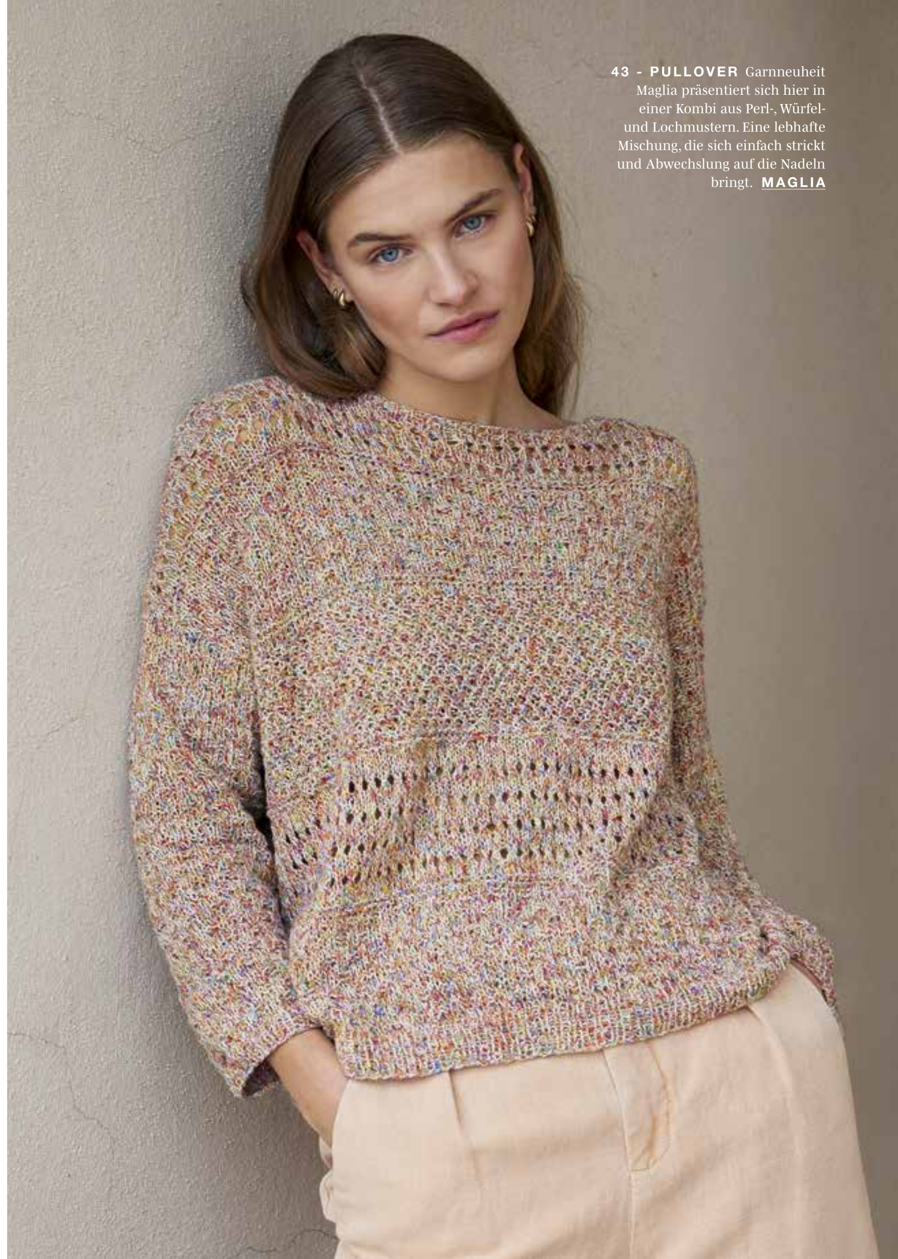
43 - PULLOVER Garnneuheit Maglia präsentiert sich hier in einer Kombi aus Perl-, Würfel- und Lochmustern. Eine lebhaft e Mischung, die sich einfach strickt und Abwechslung auf die Nadeln bringt. MAGLIA