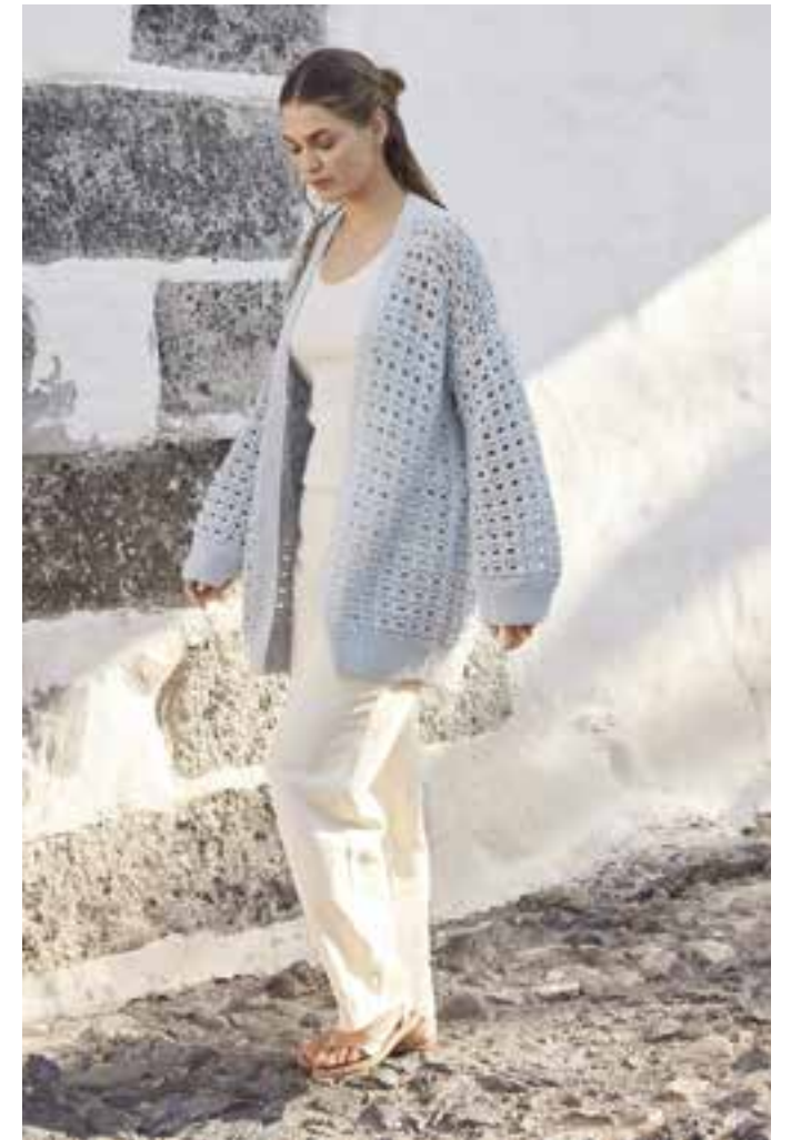
21 - Cardigan ♦ Basic mit Durchblick: Der eisblaue Cardigan in einem Strukturlochmuster, das über acht Reihen läuft. Die Form des Modells ist gerade und unkompliziert, auch die vordere Blende wird einfach mitgestrickt. ♦ LANDLUST BAUMWOLLE