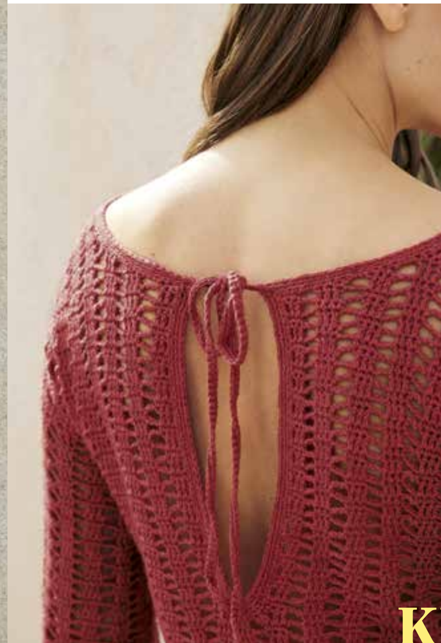
40 - KLEID Klein aber boho – das rostrote Häkelkleid in angesagter Minilänge. Sexy ist auch der tiefe Rückenschlitz, der im Nacken mit einem Bändchen geschlossen wird. DIVERSA