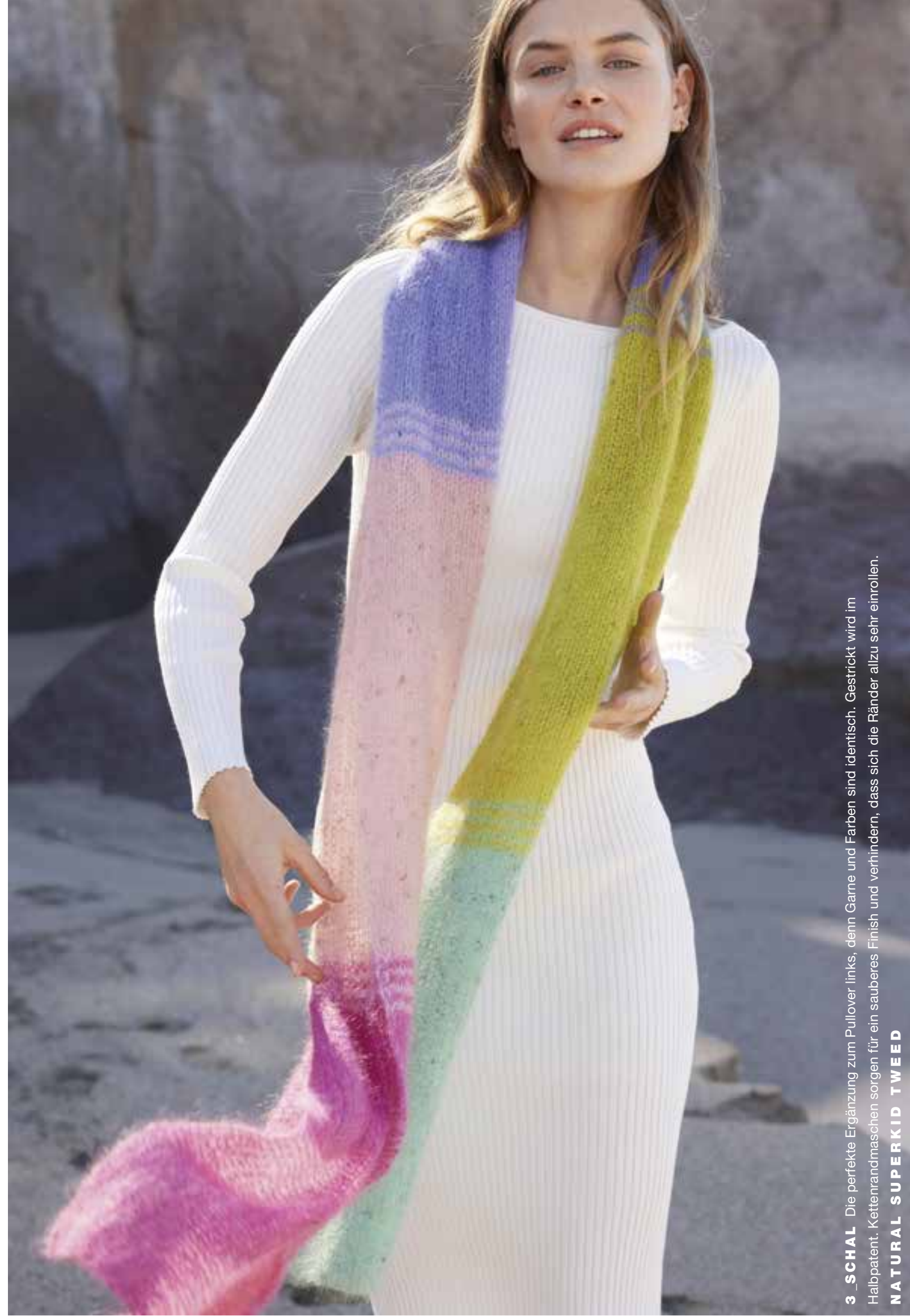
3 _ SCHAL Die perfekte Ergänzung zum Pullover links, denn Garne und Farben sind identisch. Gestrickt wird im Halbpatent. Kettenrandmaschen sorgen für ein sauberes Finish und verhindern, dass sich die Ränder allzu sehr einrollen. NATURAL SUPERKID TWEED