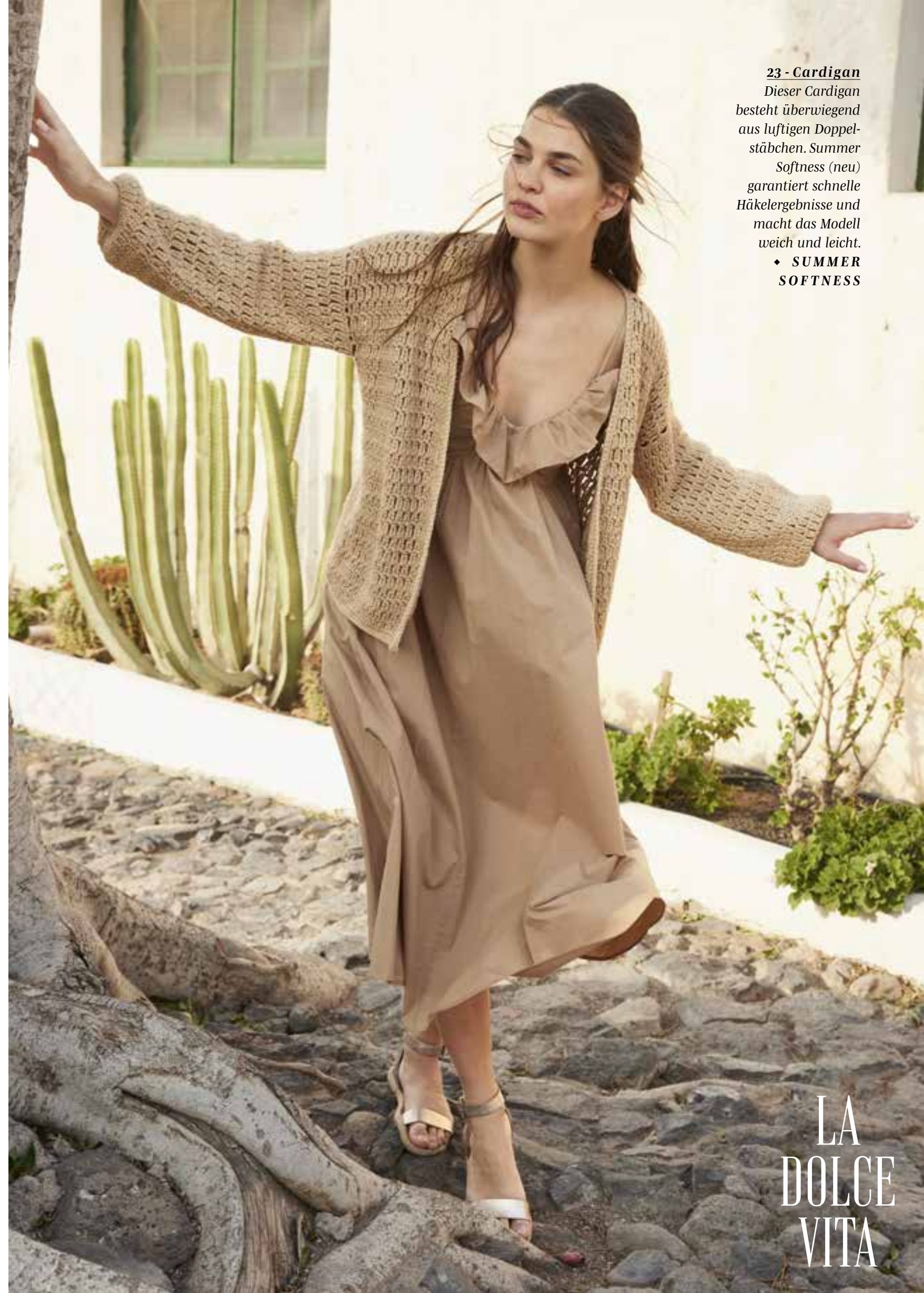
23 - Cardigan Dieser Cardigan besteht überwiegend aus luftigen Doppelstäbchen. Summer Softness (neu) garantiert schnelle Häkelergebnisse und macht das Modell weich und leicht. ♦ SUMMER SOFTNESS