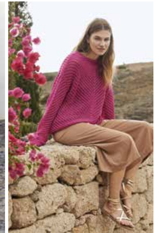
Seite 52 Modell 41