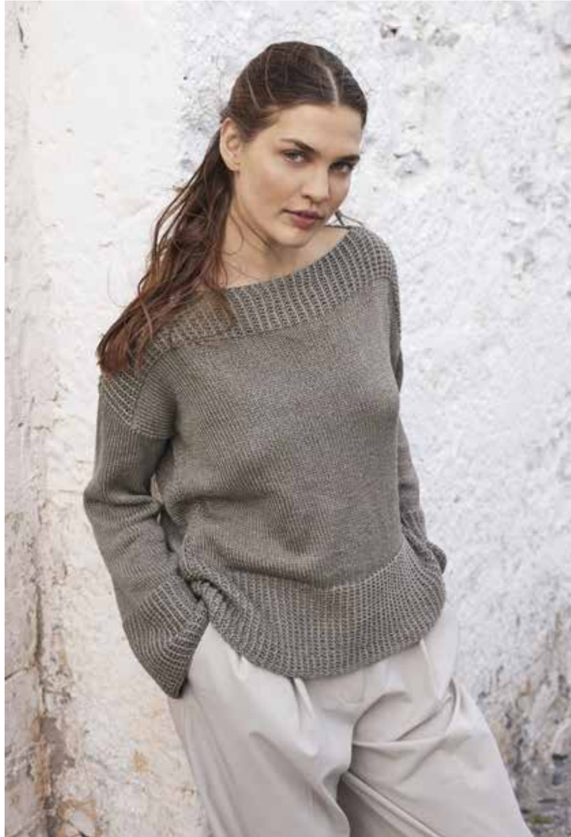
34 - Pullover ♦ Die Schlauchqualität Cotton Silk (neu) beschert unserem Pullover einen weichen Fall und traumhaften Glanz. Breite Hebemaschenmuster-Blenden akzentuieren das schlichte Modell, der U-Boot-Ausschnitt inszeniert die Schultern. ♦ COTTON SILK