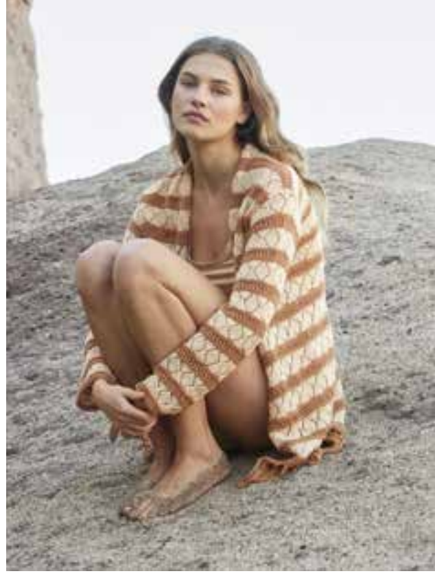
7 _ CARDIGAN Beim geraden, hüftlangen Cardigan wechseln Rauten- und Lochmuster streifenweise. Dazu gibt es lange Fransen, die jeden Hüftschwung zum Schauspiel machen. SOTTILE