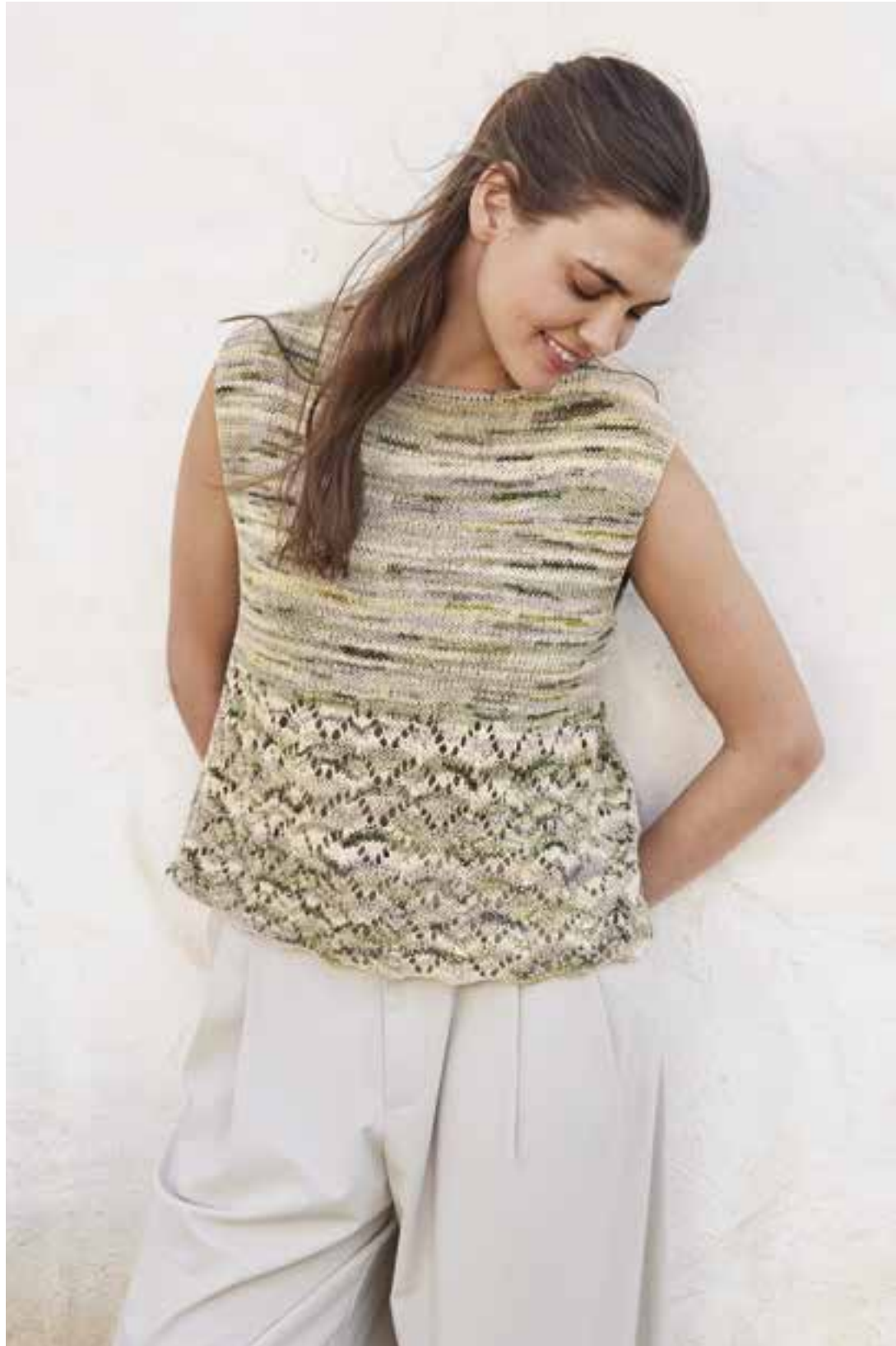
26 - Top ♦ Verlaufs-garn Torto (neu) kreiert strukturierte Strickbilder mit subtilem Glanz. Bei diesem gerade geschnittenen Top wurde es glatt rechts und im Ajourmuster verstrickt. ♦ TORTO