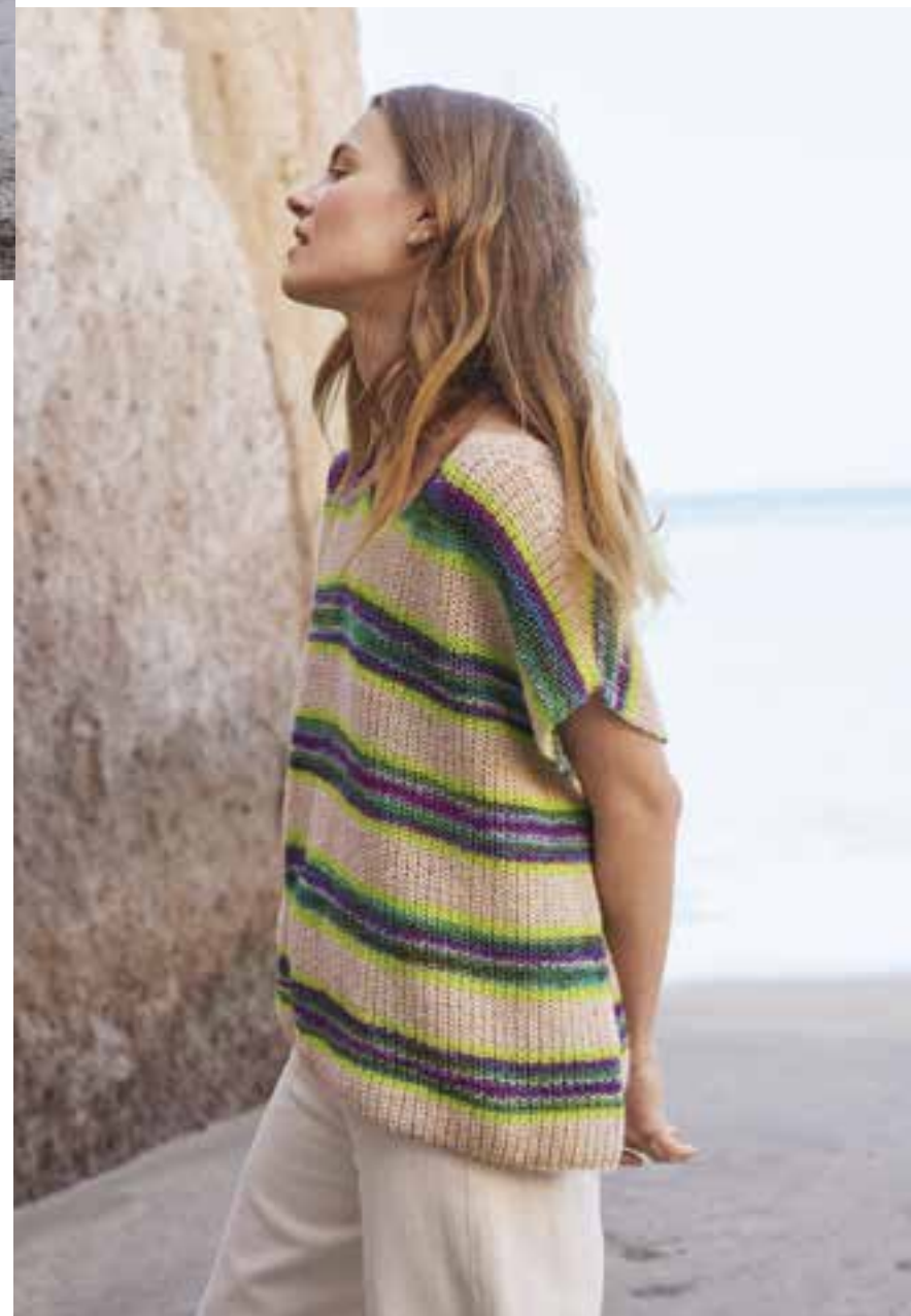
15/16 _ SHIRT Extraweit, im Halbpatentmuster und mit Streifen im Farbverlauf: Dieses Shirt gefiel uns so gut, dass wir es in zwei verschiedenen Varianten stricken mussten. Seine gerade Silhouette ist anfangsfreundlich, der Ausschnitt entsteht durch betonte Abnahmen. ECOPUNO & GIANNA