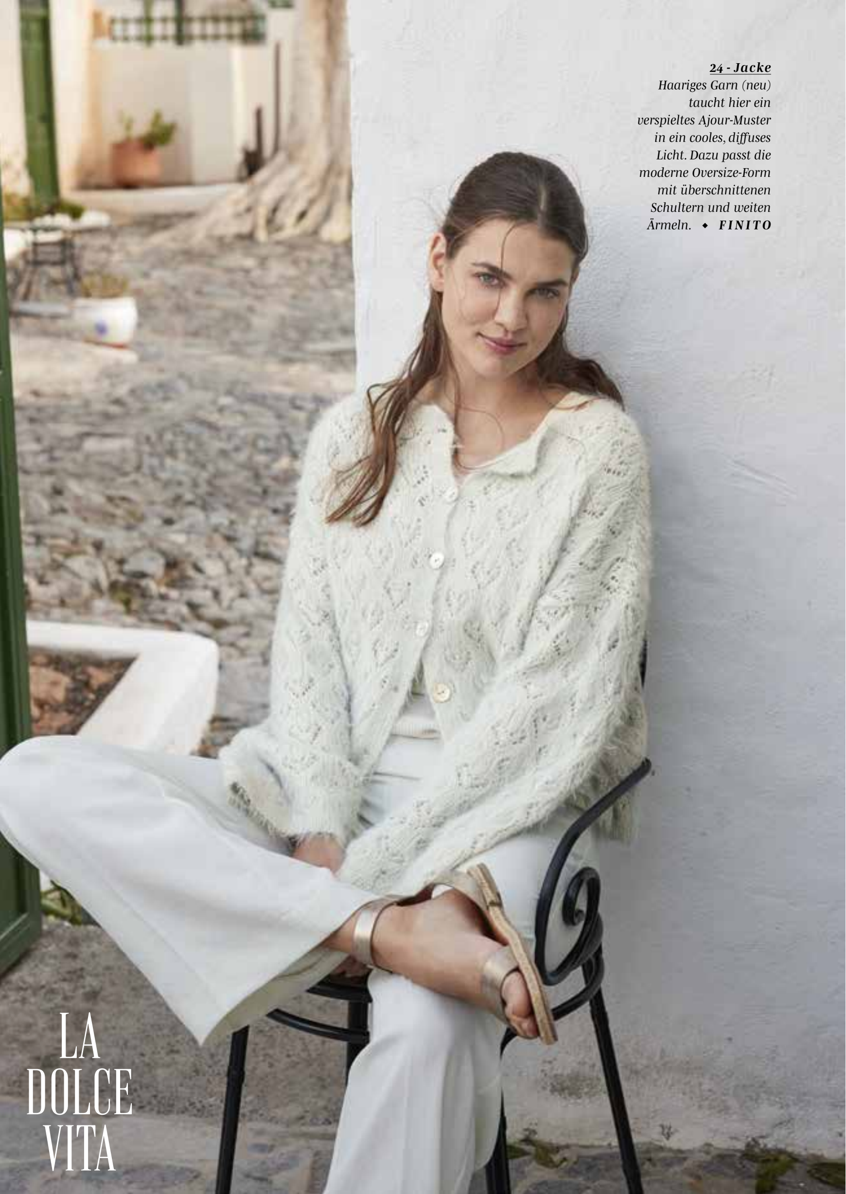
24 - Jacke Haariges Garn (neu) taucht hier ein verspieltes Ajour-Muster in ein cooles, diffuses Licht. Dazu passt die moderne Oversize-Form mit überschnittenen Schultern und weiten Ärmeln. ♦ FINITO