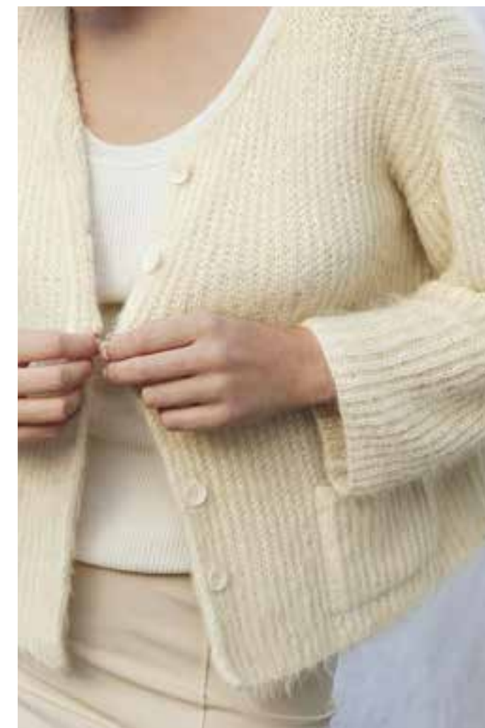
27 - Jacke ♦ Ein Halbpattentmuster und cremefarbenes Flauschgarn (neu) machen unsere Jacke elegant UND sportlich. Hübsche Details: verkürzte Ärmel und kleine, aufgesetzte Taschen. ♦ FINITO