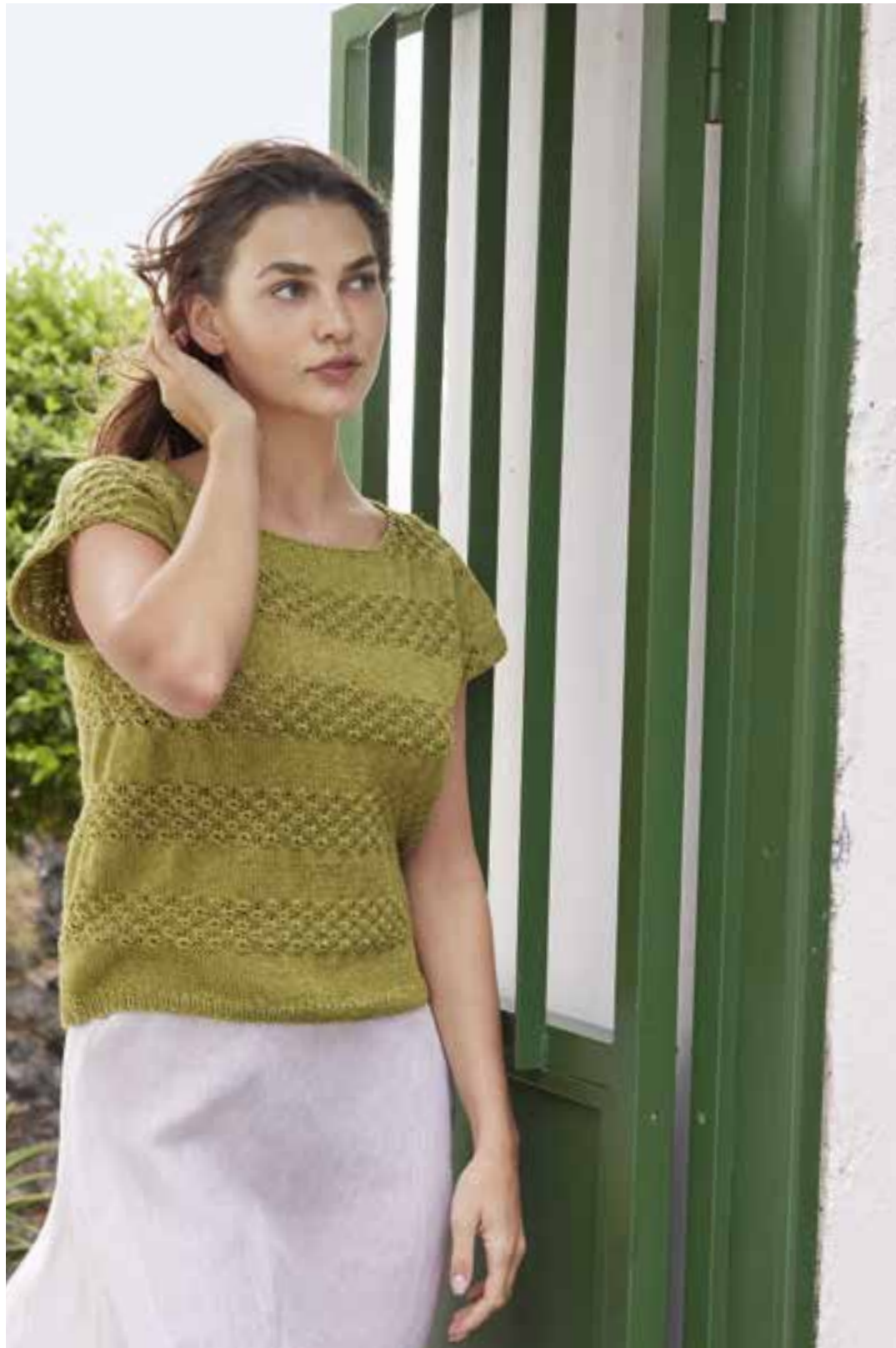
18 - Top ♦ Pistaziengrün passt beinahe zu allem. Hier schmückt es ein unkompliziertes Top mit Blütenmusterstreifen und angestrickten Miniärmeln. Leichte Schultherschrägen optimieren die Passform. ♦ DIVERSA