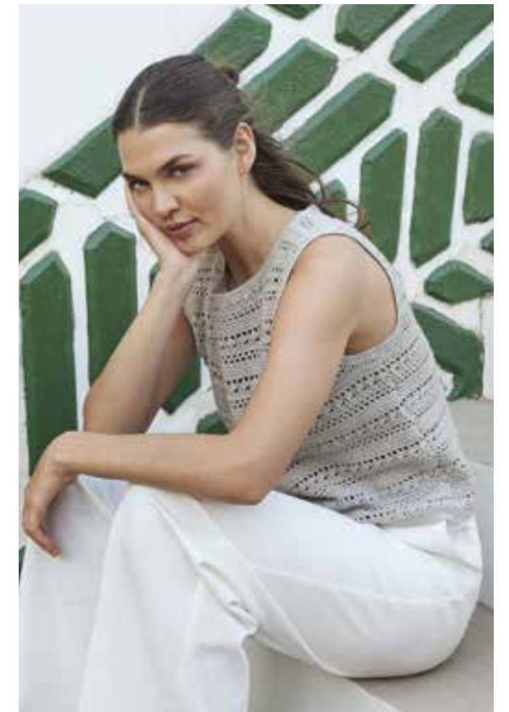
25 - Top ♦ Das Top in luxuriösem Pastellgrau adelt sportliche Outfits und setzt eleganten die Krone auf. Es wurde im Lochmuster gehäkelt und ist an Hals und Armen leicht ausgeschnitten. ♦ SOTTILE